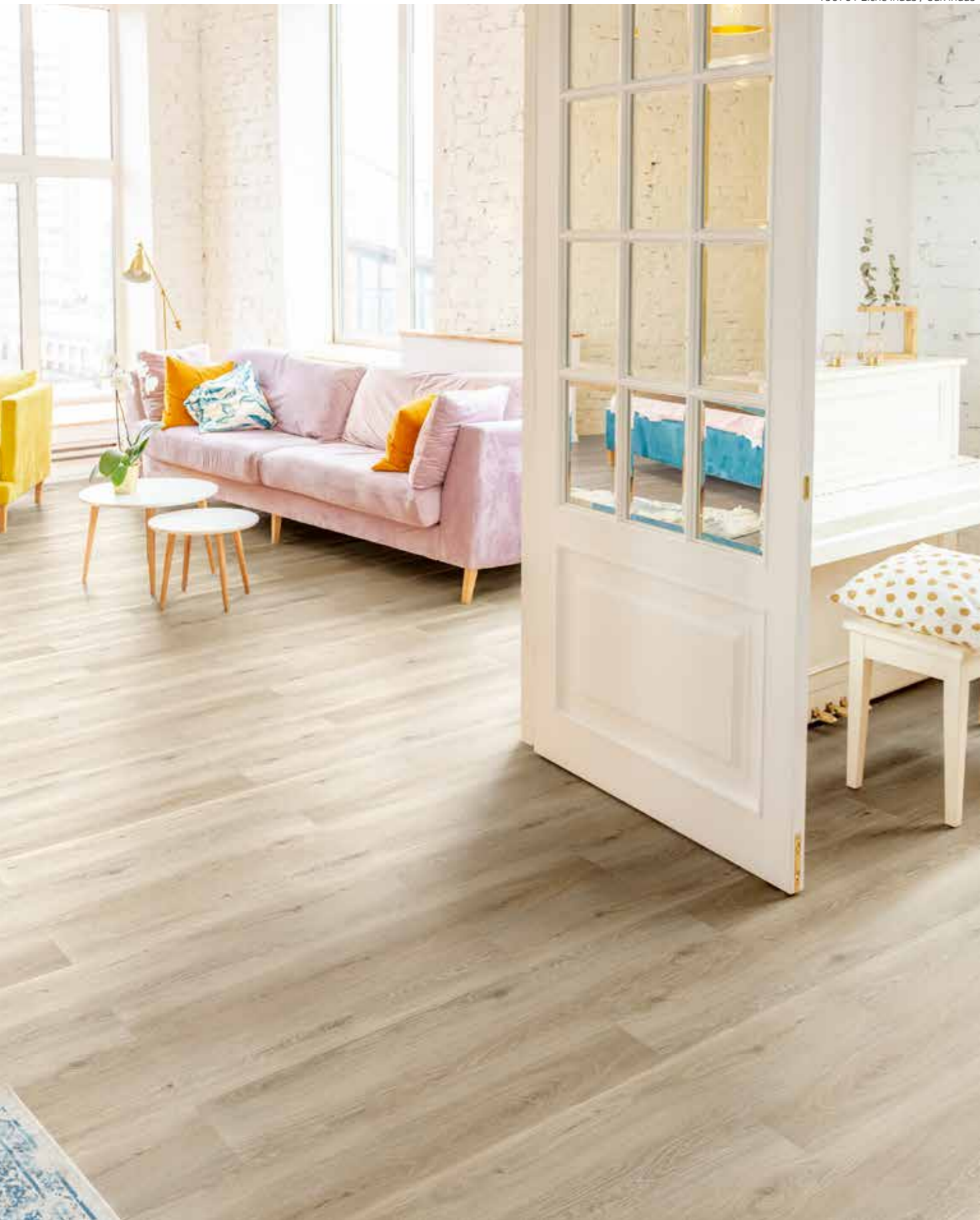
190701 Eiche Indus / Oak Indus