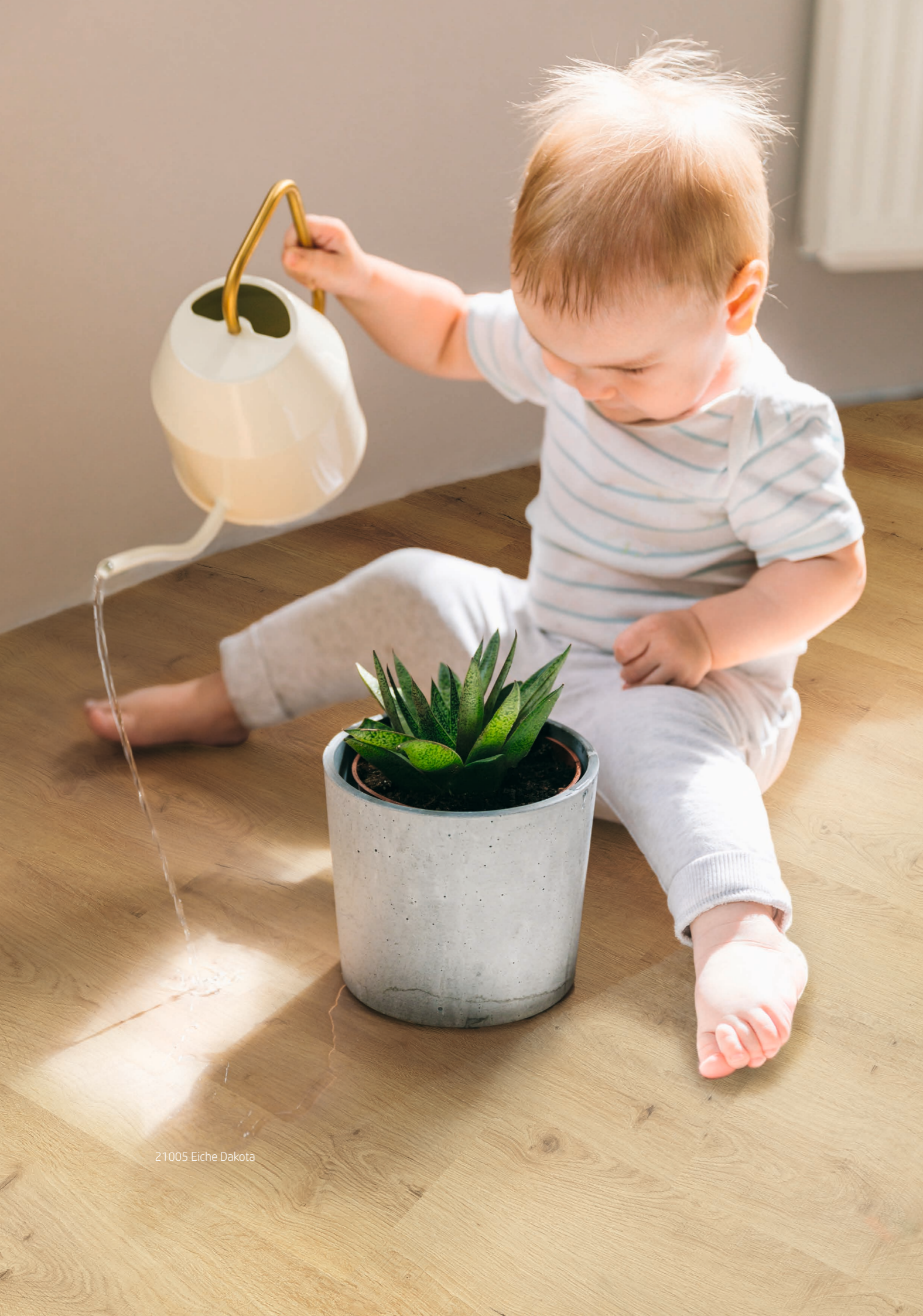
21005 Eiche Dakota

Unsere Vinylböden sind ausserdem 100% phthalatfrei und frei von jeglichen gesundheits-schädlichen Stoffen.